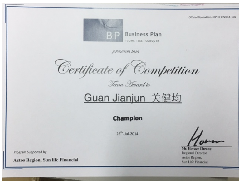
商業策劃研討證書 樣板